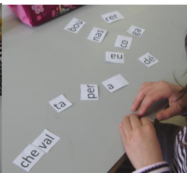
reconstitution de mots à partir de cartes syllabes