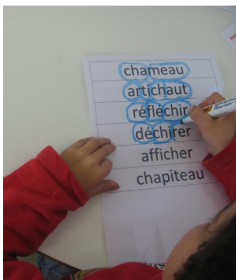
Fiche avec une liste de mots à découper en syllabes