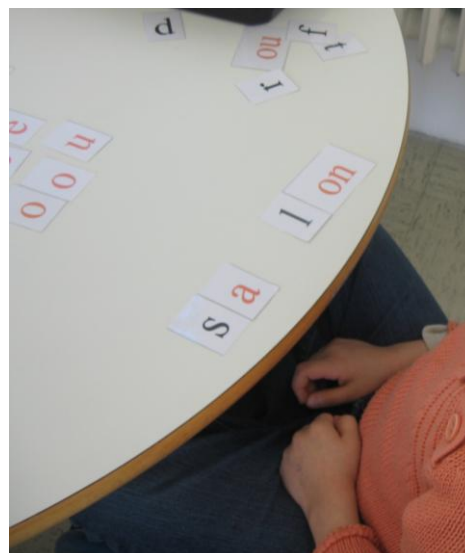
reconstitution d'un mot à partir des cartes graphèmes