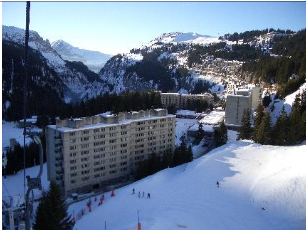
Flaine en Haute Savoie