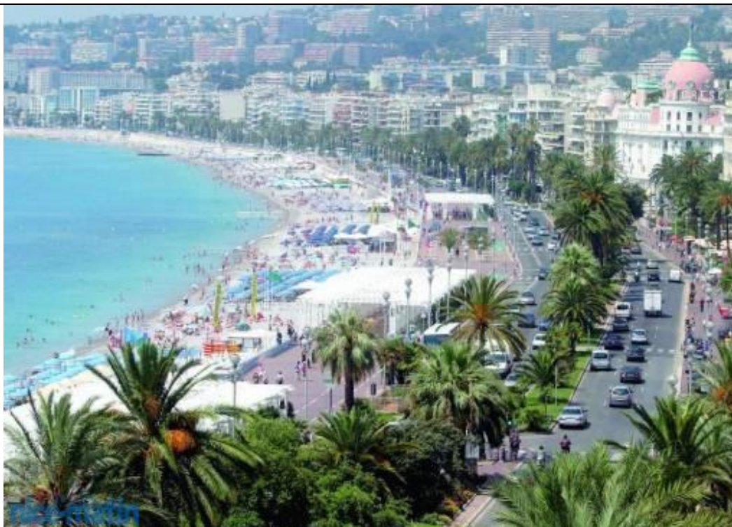
Plage de Nice http://www.nicematin.com/ta/week-end/134025/nice-littoral-et-haut-pays-pris-d-assaut