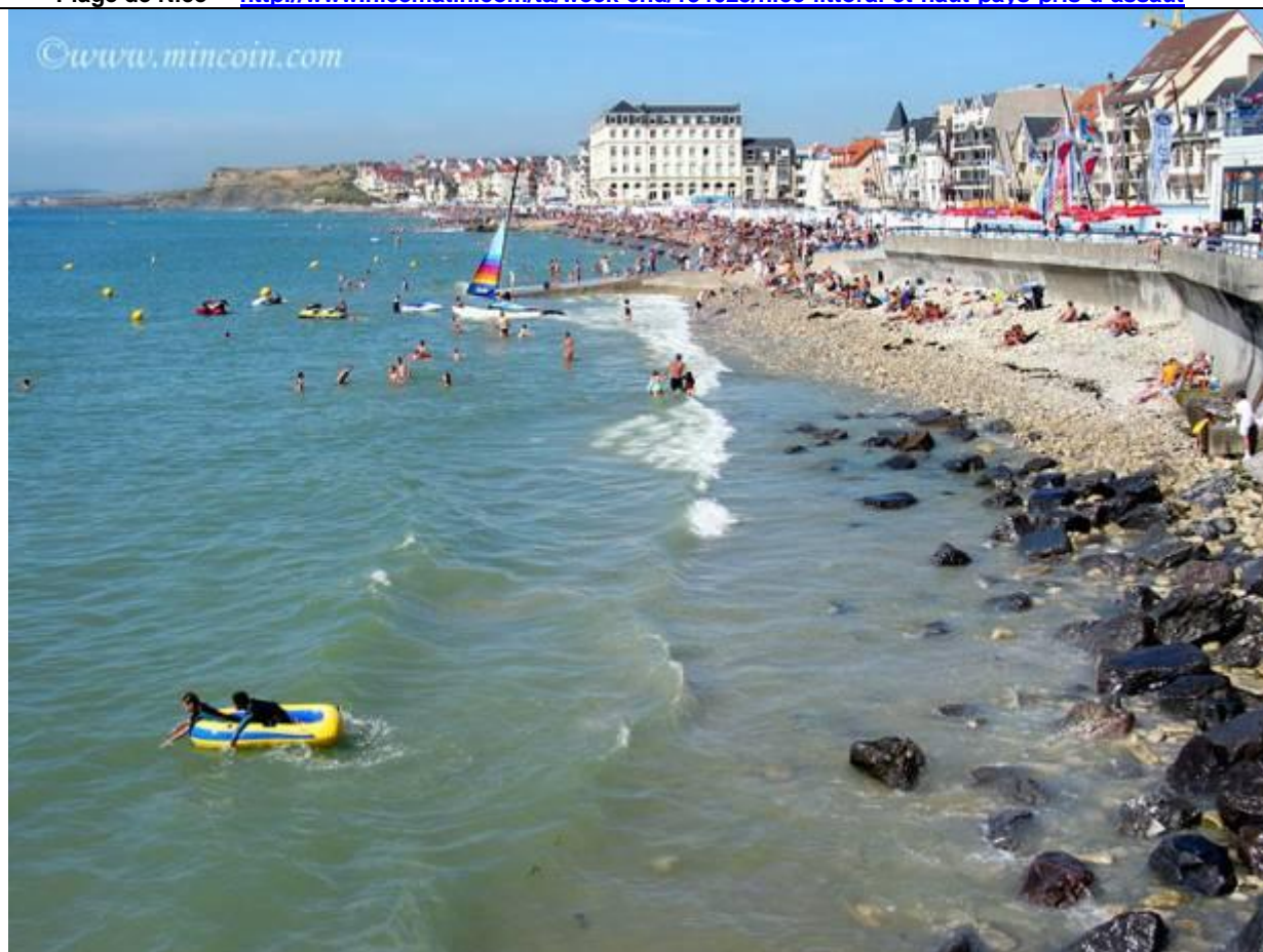
Boulogne sur mer http://www.mincoin.com/php1/wim19.php