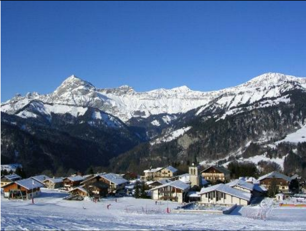
Crest-Voland en Haute Savoie