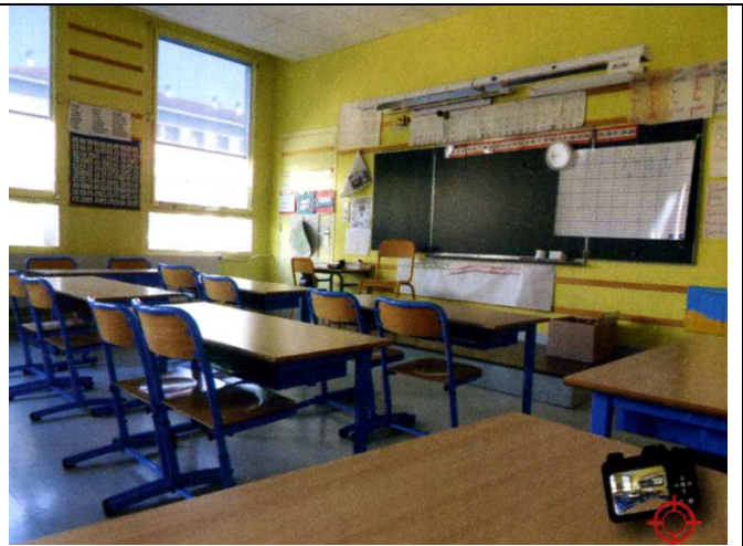
Photo prise de la place d'un élève

Questionner les photographies (projection)