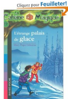
Titre : L' étrange palais de glace Auteur : Mary pope Osborne

Tom et Léa partent à la cabane magique pour voir s'il y a des missions à résoudre. Ils reçoivent un message de leur ami qui leur demande de l'aide. En effet, ce dernier est le prisonnier du sorcier. Pour le sauver, Tom et Léa doivent retrouver l'œil de ce jeteur de sorts. Ils rencontrent des sorcières qui vont les aider à libérer leur ami.