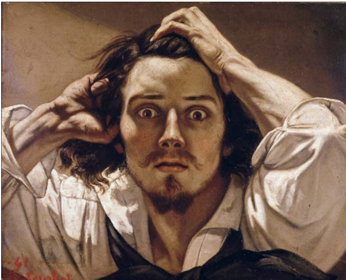
Gustave Courbet, Portrait de L'Artiste, dit Le Désespéré , 1841, huile sur toile, 45 x 55 cm, collection privée.

Gustave Courbet, Portrait de L'Artiste, dit Le Désespéré, 1841