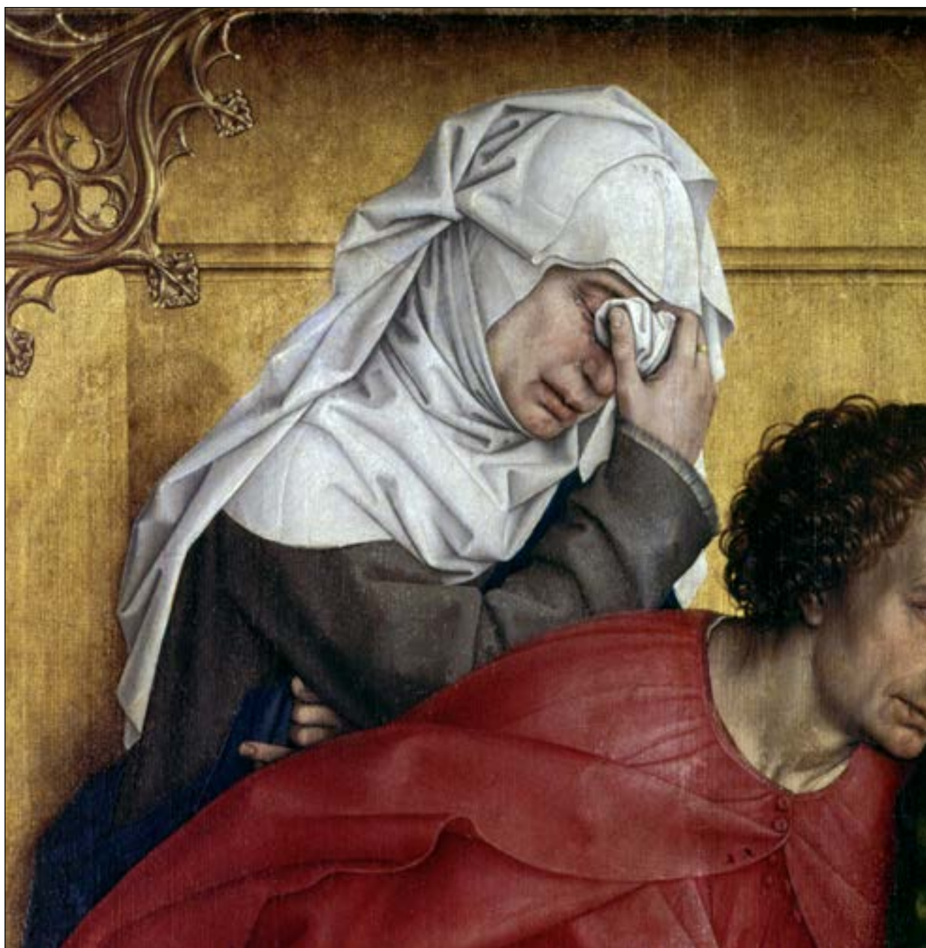
Rogier Van Der Weyden, La Déposition , 1435, huile sur toile, Musée du Prado, Madrid. (détail).

Rogier Van Der Weyden, La Déposition , 1435 (détail)