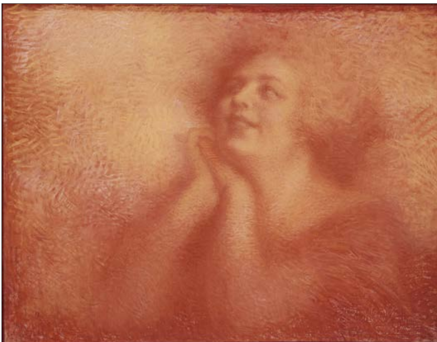
Lucien Levy-Dhurmer, Hymne à La Joie , vers 1906, pastel rouge, Petit Palais, musée des Beaux-Arts de la Ville de Paris, Paris.

Lucien Levy-Dhurmer, Hymne à La Joie , vers 1906