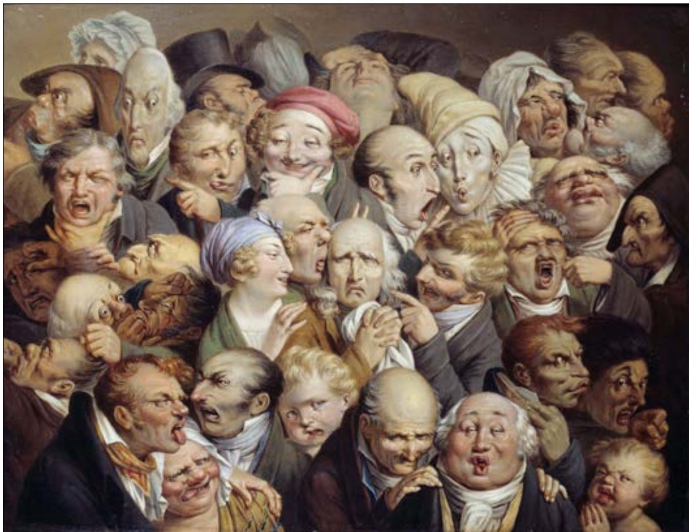
Louis-Léopold Boilly, Étude de 35 têtes d'expression , vers 1825, huile sur bois, Musée des Beaux-arts Eugène Leroy, Tourcoing.

Louis Boilly, Étude de 35 têtes d'expressions, vers 1825